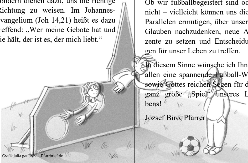
Grafik Julia gandraš – Pfarrbrief.de

B. Im Glauben: Im geistlichen Leben besitzen Gebote dieselbe Bedeutung. Sie engen unsere Freiheit nicht ein, sondern dienen dazu, uns die richtige Richtung zu weisen. Im Johannes-evangelium (Joh 14,21) heißt es dazu treffend: „Wer meine Gebote hat und sie hält, der ist es, der mich liebt.“